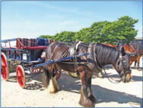
'&1%&+432$)& "4' "1+