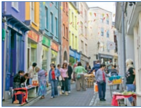
)/00*(. * 3 &3&1 /13