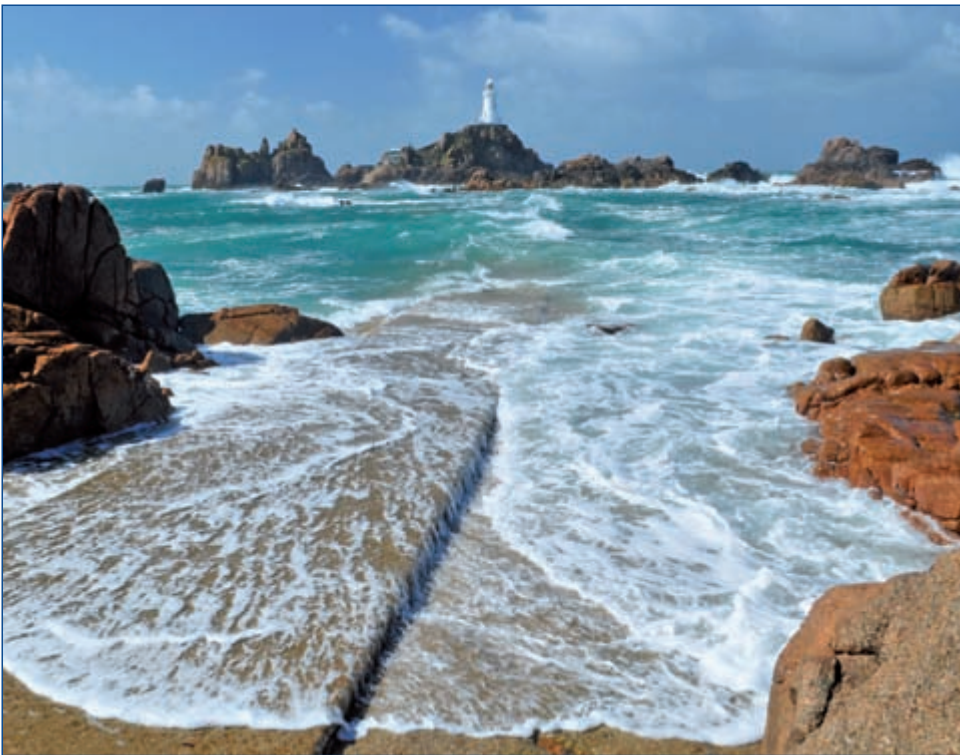
&4$)3341- " /1#*<1&

ufgrund der Lage am Golfstrom haben die britischen Kanalinseln ein „Klima, das für den Müßiggang wie geschaffen ist“ (Victor Hugo, 1855). Atemberaubende Küstenabschnitte und entzückende Fischerhäfen verzaubern jeden Besucher. Jersey, die größte der Kanalinseln, hält Englands Sonnenscheinrekord. Kilometerlange Sandstrände, dazwischen romantische Buchten und bunte Blumentepiche, wechseln sich ab mit Palmen und einer üppigen Vegetation im Inselinneren. Zahlreiche Küstenwege laden zu erholsamen Spaziergängen ein. Man kann sich kaum einen besseren Ort vorstellen, um sich in der frischen Meeresluft zu entspannen und vom Alltagsstress zu erholen. Dazu die Wärme und Freundlichkeit der Inselbewohner, die von einer wohltuenden Mischung aus britischer Gemütlichkeit und französischer Lebensfreude geprägt sind – entdecken Sie mit uns dieses ausgefallene Zielgebiet mitten in Europa. Britischer Lifestyle und französisches Savoir-vivre werden Sie noch lange begleiten.