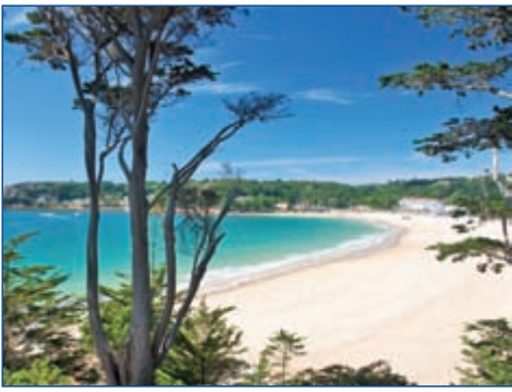
3 1&,"%&2 "8